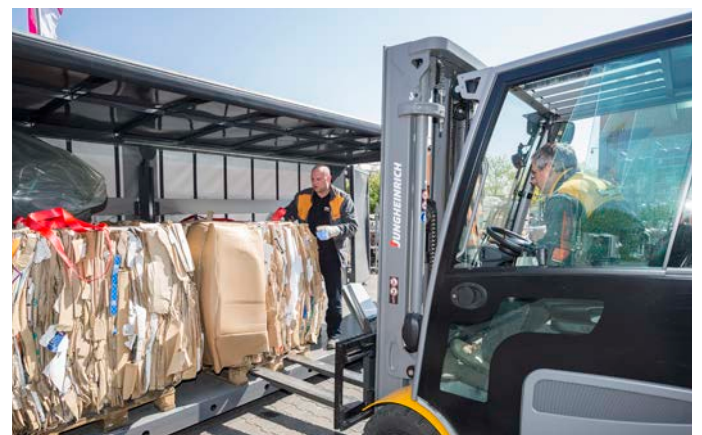
Een „recycletruck“ van Hornbach wordt geladen