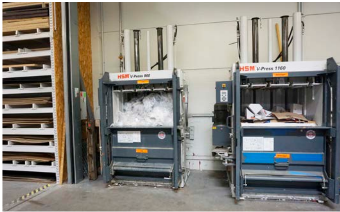
HSM Verticale Balenpersen V-Press 860 en 1160