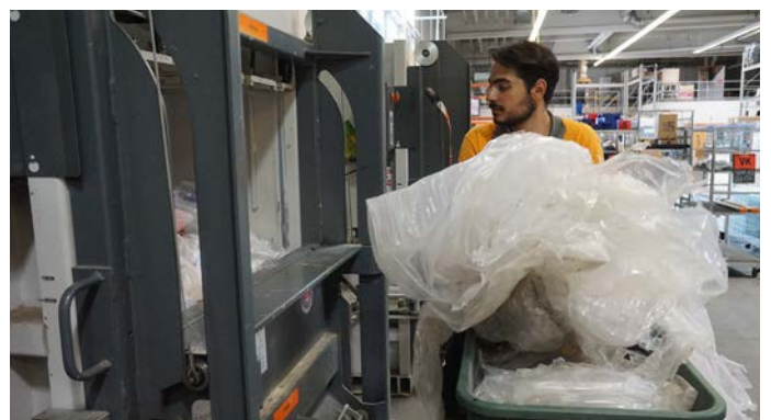
Riempimento di una pressa HSM V-Press 860 con plastica da imballaggio

mo semplicemente avuto un'ottima impressione. Il pacchetto completo di HSM era perfetto". Le presse imballatrici a scaffale HSM hanno un'elevata forza di compressione, richiedono poco spazio, sono facili da usare e durante il funzionamento continuo "non danno nell'occhio". Successivamente, Hornbach ha dotato i propri magazzini in nove Paesi europei e diversi centri logistici di presse imballatrici verticali di HSM. Al momento Hornbach dispone di oltre 330 Presse HSM. I collaboratori dell'area entrata merci dei singoli mercati ora riversano il materiale da imballaggio nelle macchine, lo comprimono e immagazzinano le balle. Una volta alla settimana la flotta di autocarri di Hornbach ("contenitori di riciclaggio rifiuti") preleva questi costosi beni e li porta nei centri di trasbordo, da dove i riciclatori li prelevano. "I riciclatori apprezzano il materiale Hornbach per la sua alta qualità e purezza di varietà", riferisce Andreas Back.