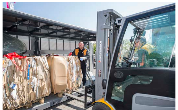
Carico di un "contenitore di riciclaggio rifiuti"

Uno dei grandi vantaggi delle presse imballatrici a scaffale HSM è la loro mobilità. Quando viene riorganizzata un'entrata merci, le macchine HSM vengono facilmente riposizionate, afferma Back. Dopo molti anni di collaborazione, traccia un "bilancio assolutamente positivo" sulla qualità del servizio del suo produttore di presse. "Abbiamo sempre un referente raggiungibile e siamo aiutati rapidamente e senza problemi." Anche dal punto di vista gestionale, la riorganizzazione basata sui prodotti HSM in Hornbach è un successo. Oggi Hornbach fornisce circa 12.000 tonnellate di carta e cartone e 3.000 tonnellate di plastica per imballaggio all'anno ai suoi partner di riciclaggio. La società di ferramenta riscatta così denaro in contante. Secondo il responsabile della qualità, l'investimento è stato ripagato in tempi brevissimi. Back: "Siamo riusciti rapidamente a produrre materiali riciclati, che erano stati precedentemente