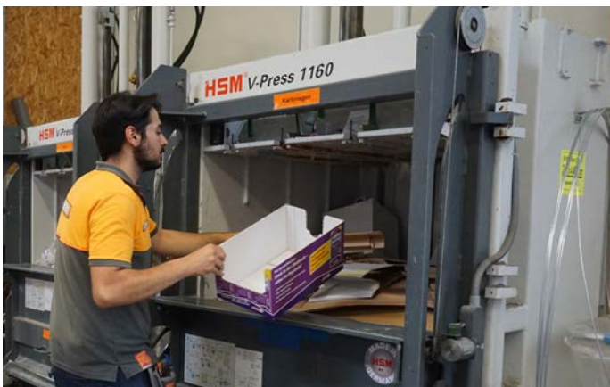
Riempimento di una pressa HSM V-Press 1160 con cartone