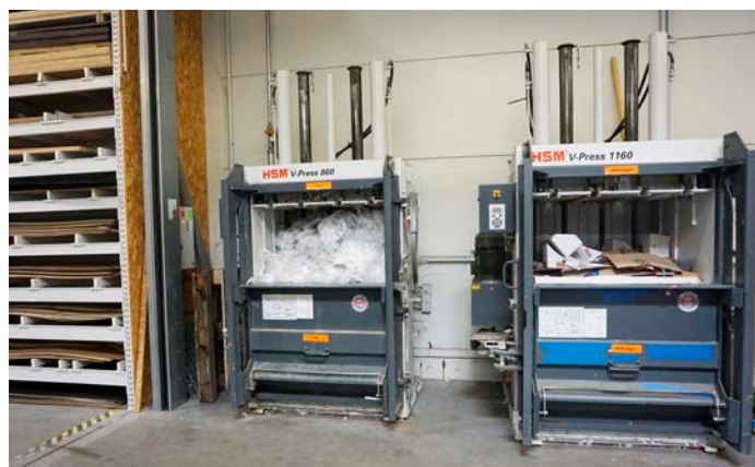
Presse verticali HSM V-Press 860 e 1160