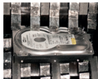
I rulli di taglio in acciaio massiccio temprati ad induzione sono molto robusti ed assicurano la massima durezza.

Anche la distruzione decentralizzata di grandi quantità di diversi tipi di supporti dati può essere fatta facilmente e comodamente, in modo economico e sicuro secondo quanto previsto dal regolamento della protezione dei dati.