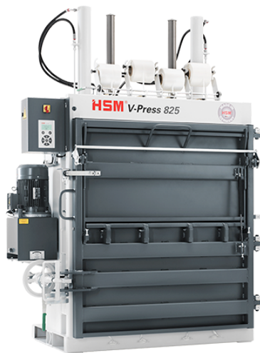
V-Press 825 Plus 630117574