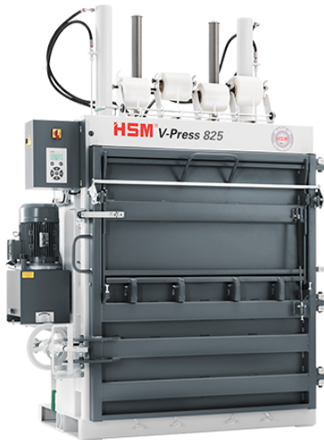
V-Press 825 Plus 430001530